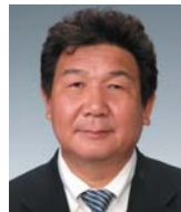
調布市議会議員 内藤 良雄